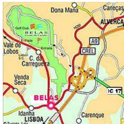
Mapa de proximidade