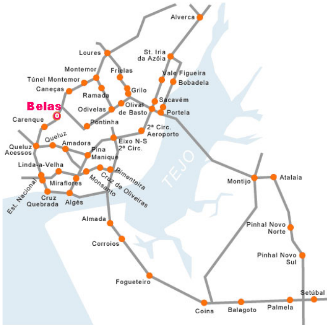
Mapa de zona, Lisboa e Sul